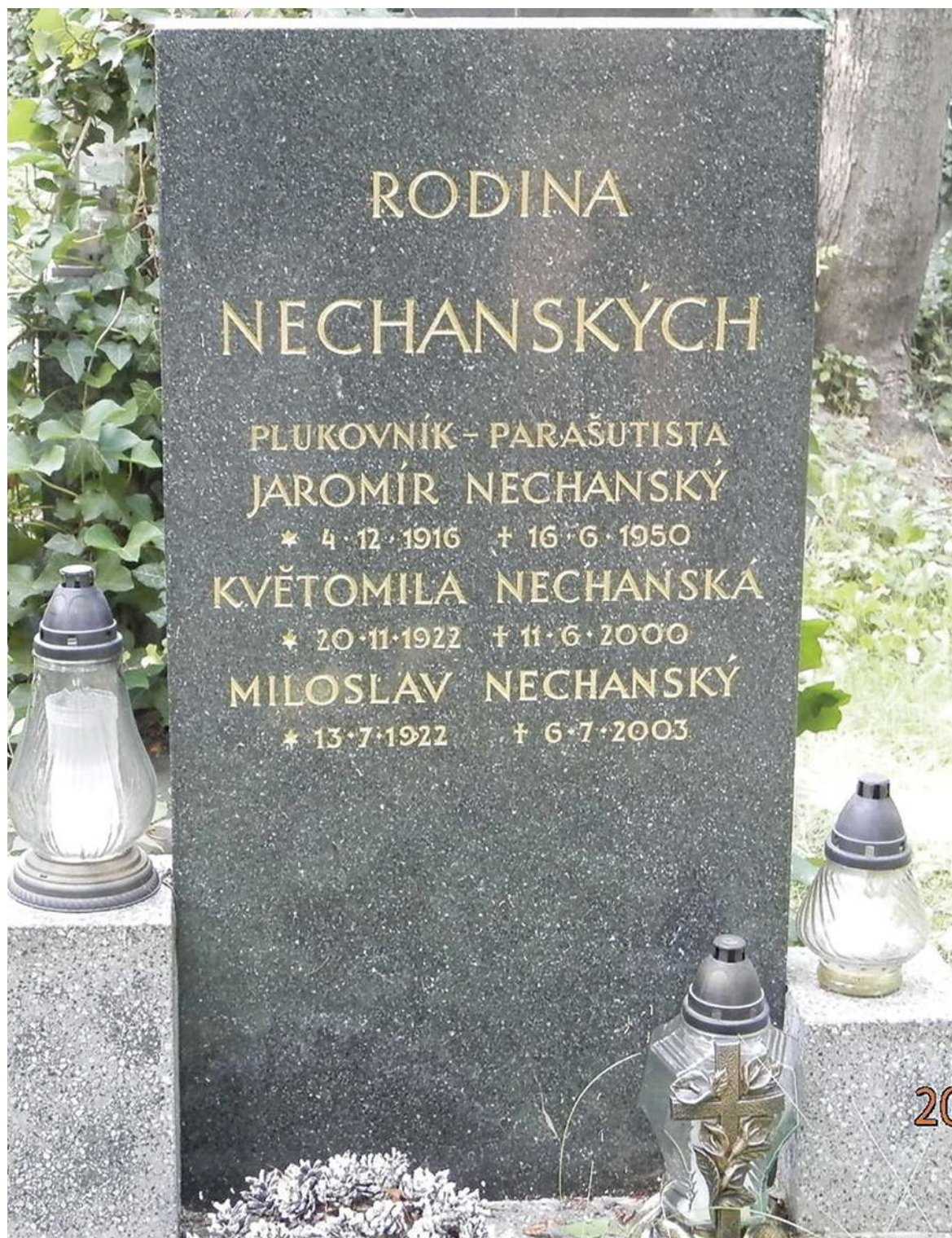
Pomník Jaromíra Nechanského na Olšanech